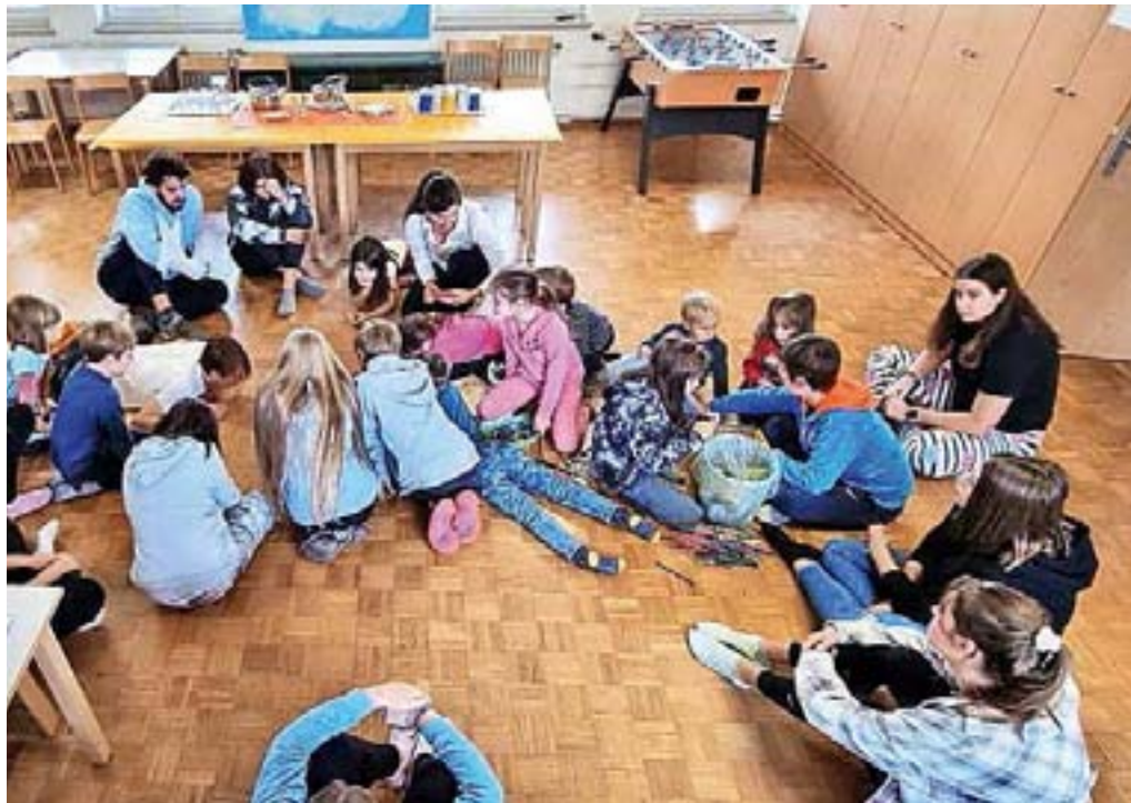
Otroci so imeli delavnico na temo čustev.

Imeli smo se »fletno« in se bomo še imeli. Dan družin bomo ponovili jeseni prihodnje leto, pred tem pa bo še veliko drugih priložnosti, da se srečamo, se imamo lepo in dobimo kakšno spodbudo za drobne, a pomembne spremembe v naših družinah. Zato, ker so družine in odnosi tisto, v kar je vredno vlagati. »Posameznik se lahko kvalitetno razvija, če so odnosi sproščeni, zdravi, var-