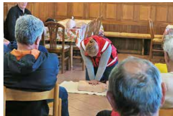
Prikaz oživljanja

Pred dvema letoma je bil AED (avtomatski eksterni defibrilator) nameščen Pr' Prgoznik, v letošnji jeseni pa Pr' Ambrožarju. Pobudo so dali domačini, ki so prispevali tudi večino denarja. »Nekaj ga je ostalo še izpred dveh let, dobršen del je zagotovila omenjena turistična kmetija, preostalo pa mi,« je pojasnil predsednik krajevne organizacije Rdečega križa Cerklje Vid Močnik. Odločitvi za nakup še ene naprave je botrovala predvsem oddaljenost med kmetijama, saj pri srčnem zastoju šteje vsaka minuta. Takojšen začetek izvajanja temeljnih postopkov oživljanja od 2- do 3-krat poveča možnosti preživetja. Kako nuditi pomoč z uporabo AED, je krajanom Ambroža in drugim