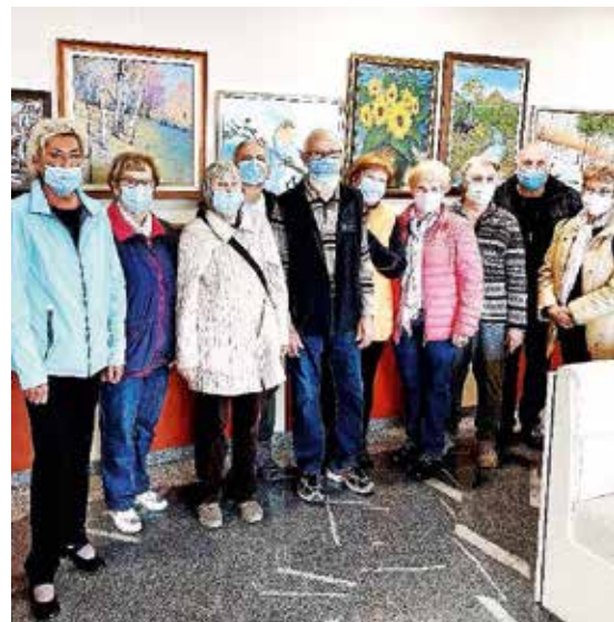
Ob odprtju razstave