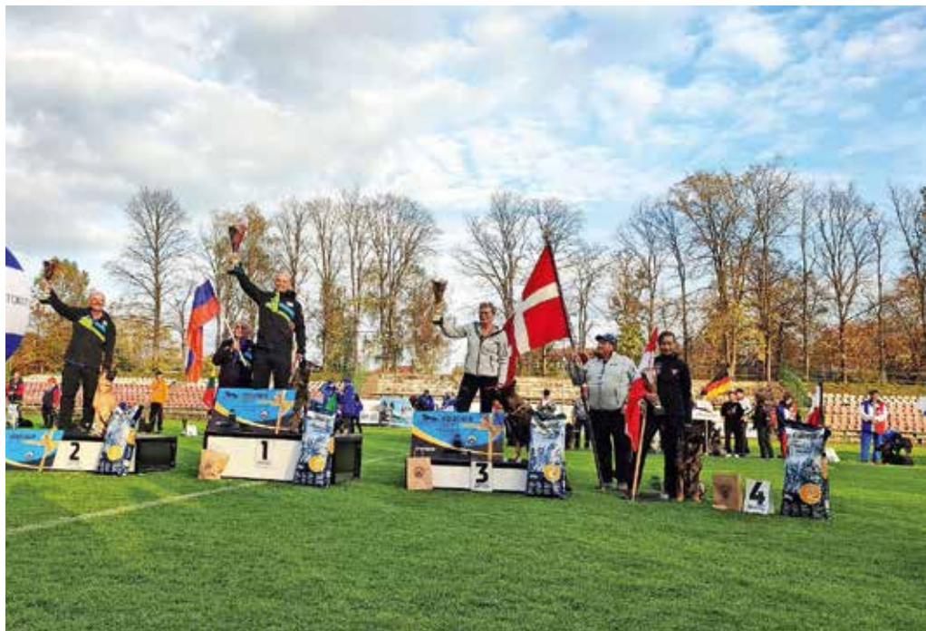
Podelitev pokalov v posamični kategoriji / Foto: osebni arhiv

Letos sta tekmovala na Poljskem, kjer se je zbralo 43 tekmovalnih parov iz 26 držav. »Vsak tekmovalni par ima dva nastopa na različnih podlagah, po navadi gre za njivo ali travnik. Proga oziroma sled je dolga 1800 korakov, stara