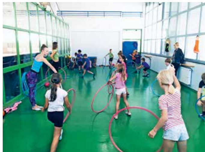
Ritmična gimnastika

Na Osnovni šoli Davorina Jenka je bil v tednu med 19. in 23. septembrom teden športa za učence od 1. do 5. razreda. Organiziran je bil z namenom, da so otroci aktivni vsaj eno uro dnevno. Spoznavali so se z različnimi športi, ki so jih predstavili trenerji atletike, košarke, nogometa, rokometa, plesa, karateja in ritmične gimnastike. V vseh razredih so se med poukom izvajale minute za zdravje, vaje za hrbtenico in zdravo držo. Organizirani so bili športni dnevi, učilnice na prostem, pohodi in dejavnosti v naravi. Vse aktivnosti so se vpisovale v zbirnik, končni rezultat pa je pokazal, da so bili učenci v petih zaporednih dneh pouka skupno aktivni več kot sedem ur.