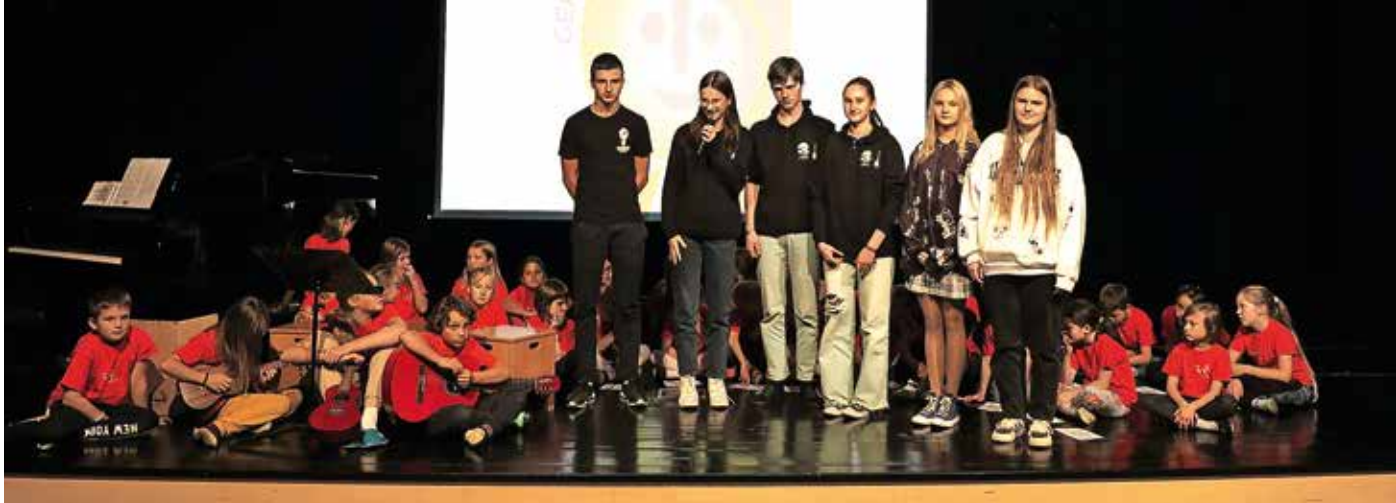
Učenci iz Latvije in starejši otroški pevski zbor, ki je zapel tudi šolsko himno