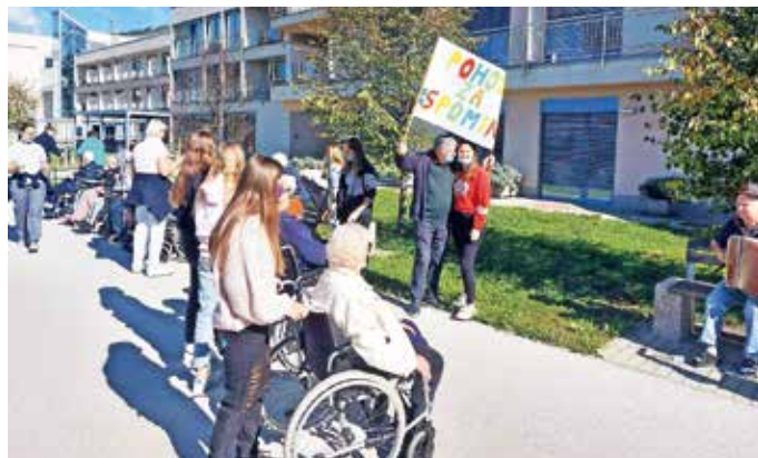
Medgeneracijsko druženje

vič in še ena glasbena točka pevk pod mentorstvom učiteljice glasbene umetnosti Irme Močnik. V imenu ZOTKS je organizatorica tekmovanja Teja Škrjanec prebrala spodbudne besede in podala osnovne informacije o samem poteku tekmovanja. Tekmovalci so imeli na voljo 90 minut, da so se spopadli z logičnimi nalogami in jih po najboljših močeh rešili. Tekmovanje se je zaključilo ob 11. uri. Z OŠ Davorina Jenka je sodelovalo 6 učencev iz 9. razreda, 6 učencev iz 8. razreda in 2 učenca iz 7. razreda. Vsem tekmovalcem čestitamo.