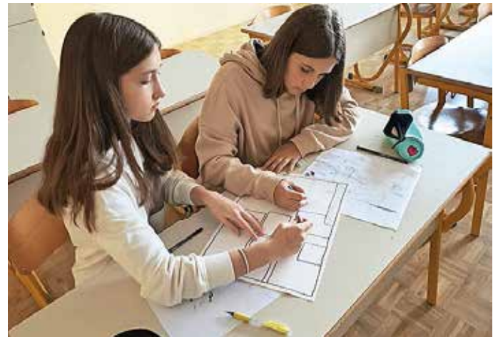
Ustvarjanje tujejezičnega stripa

sameznih prizorov iz povesti, nato pa izdelali kratek strip v angleščini. Nastale so različne izvedbe iste zgodbe, ki prikazujejo propad poženiškega gradu.