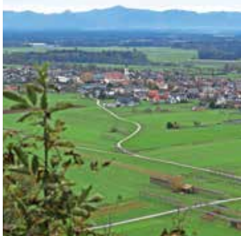
Jesenska panorama