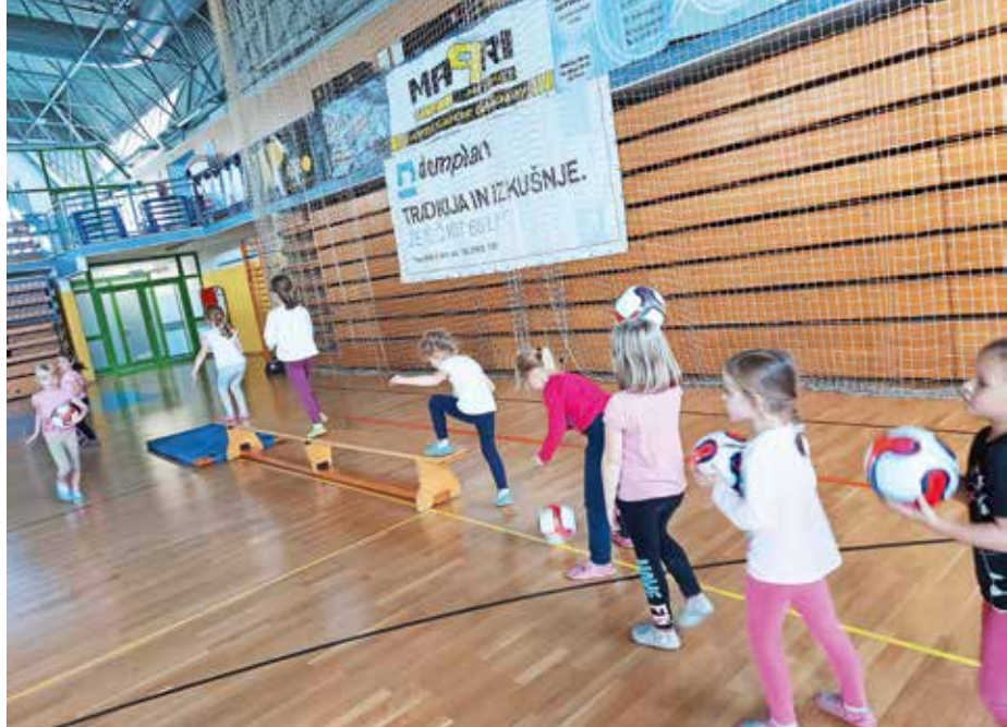
Nogometni vrtec

Otroci so se po počitnicah znova vrnil v vrtčevsko okolje med vrstnike, k vzgojiteljem, nekateri med njimi so prvič prestopili vrtčevski prag. Letos smo uvajali 58 novincev. V uvajalnem času otrokom pomagamo, da se postopno prilagodijo na spremembe, ter tesno sodelujemo s starši, družino. Za dobro počutje otrok je nujno, da se tudi starši dobro počutijo, ko zaupajo svojega otroka novim ljudem. Zaupanje staršev v vrtec in naše delo se prenaša tudi na otroka. Želimo si, da bi vrtec (p)ostal skupen prostor življenja otrok in odraslih, kjer poveza-