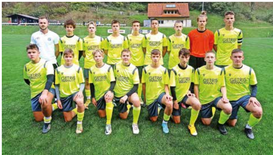
Kadetska ekipa U16 v sezoni 2022/2023

Navdušujejo tudi naše mlajše selekcije, ki v svojih starostnih kategorijah po jesenskem delu tekmovanj posegajo po najvišjih mestih. Ekipa U13 je končala tekmovanje na 2., U14 na 5. in kadetska ekipa U16 na 3. mestu. Rezultati so odraz sistematičnega dela z mlajšimi selekcijami v zadnjih štirih letih in tega, da nam je v klub uspelo privabiti odlične trenerje, ki verjetno sestavljajo trenutno najboljšo trenersko ekipo na Gorenjskem. Prav tako nam je za novo sezono uspelo postaviti celotno otroško piramido po letnikih vse do najmlajše selekcije, ki jo sestavljajo predšolski otroci. Ravno zaradi te odlične trenerske ekipe tudi v tej