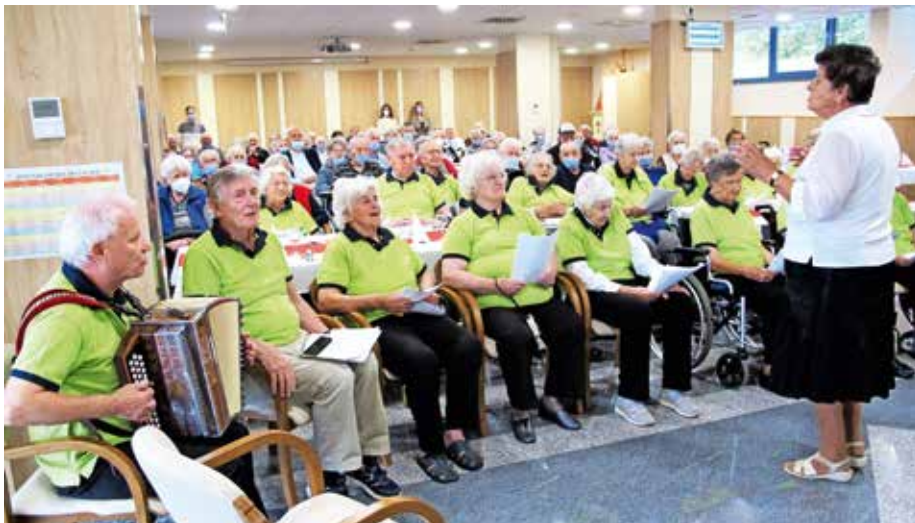
Praznovanje sedme obletnice