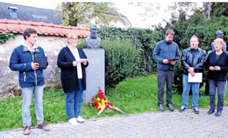
Člani KUD Pod lipo Adergas