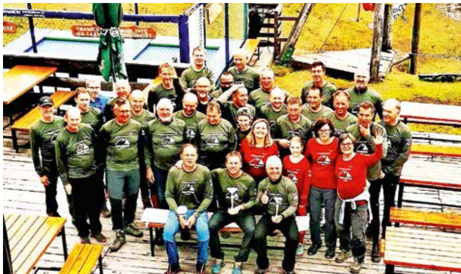
Junaki Krvavca 2022