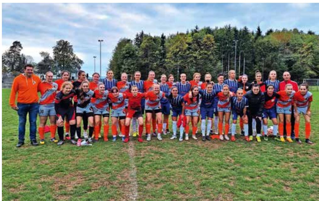
Ekipa ŽNK Cerklje in nogometašice s Kosova