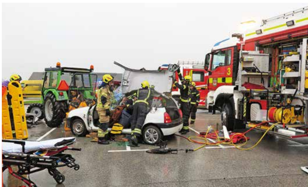
Prikaz posredovanja ob prometni nesreči

PGD Šenturška Gora je pripravil predstavitev različnih gasilnih aparatov s praktičnim prikazom gašenja, v Cerkljah pa je bil Dan odprtih vrat. Društvo, ki letos praznuje 130-letnico, je poleg vozil in druge opreme predstavilo delo prvih posredovalcev, temeljne postopke oživljanja in uporabo defibrilatorja. Prikazalo je posredovanje ob požaru v stanovanjski stavbi ter reševanje poškodovanega delavca s strehe s pomočjo vrhne tehnike in s teleskopskim dvigalom oziroma avtolestvijo, posebej veliko